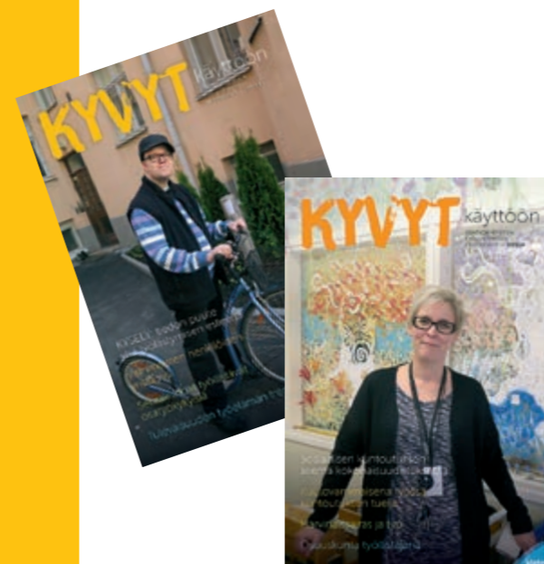
Kyvyt käyttöön -lehtiä ilmestyi kaksi. Ensimmäisen pääteemana oli vammaisten ja osatyökykyisten henkilöiden työllistymistä edistävät ja vaikeuttavat asiat, toisessa työhön ja työssä kuntoutumisen keinot.