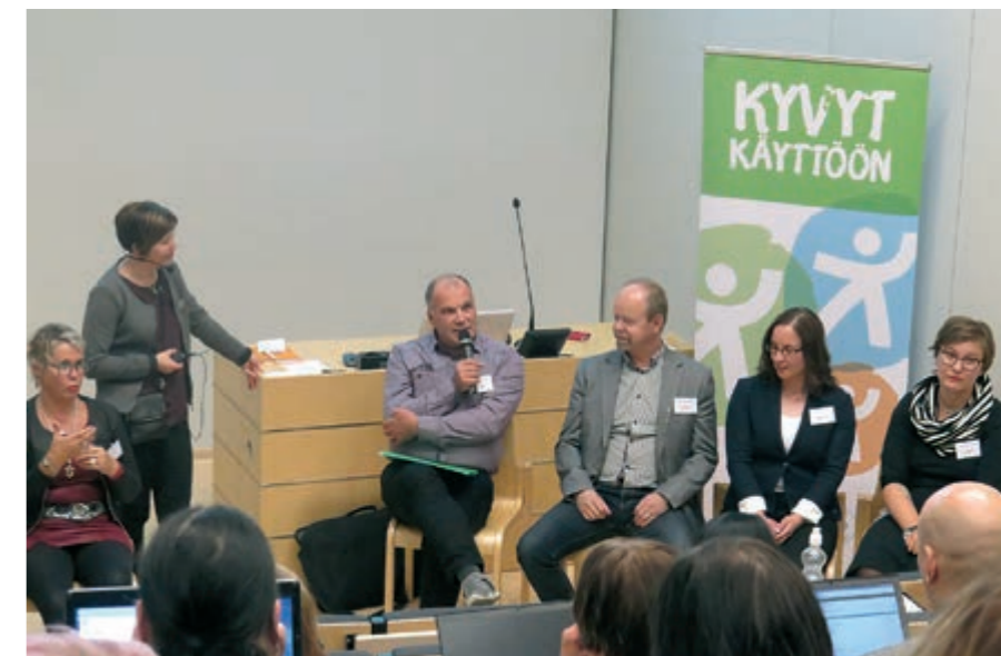
Kyvyt käyttöön -seminaarissa Seinäjoella paneelikeskustelussa käsiteltiin työhönvalmennuksen tavoitteita. Millaisia keinoja se nyt antaa työelämään siirtymiseen ja missä olisi vielä kehitettävää?

Palaute oli pääosin positiivista, etenkin yhteiselle keskustelulle ja pohdinnalle varattua aikaa kiiteltiin. Seminaarin teemoiksi toivottiin jatkossa työelämän monimuotoisuuden kehittämisen ja yritys yhteistyön kysymyksiä sekä eri hankkeissa kehitettyjen hyvien toimintatapojen jakamista.