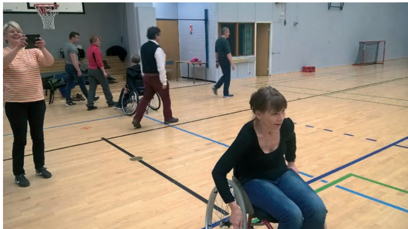
Vateslaiset viettivät virkistyspäivää mm. Lahden Nastolassa Liikuntakeskus Pajulahdessa, jossa kokeiltiin istumalentopalloa ja pyörätuolikoripalloa.