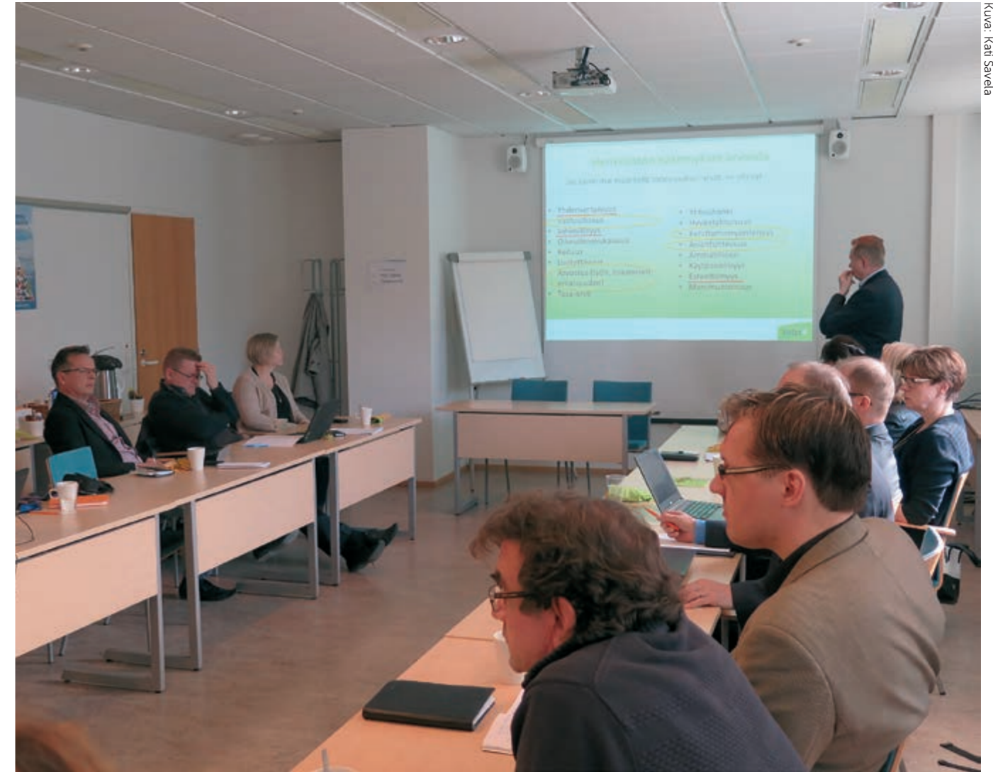
Henkilöstö ja Vatesin hallitus pitivät keväällä yhteisen palaverin, jossa suunniteltiin uutta strategiaa.