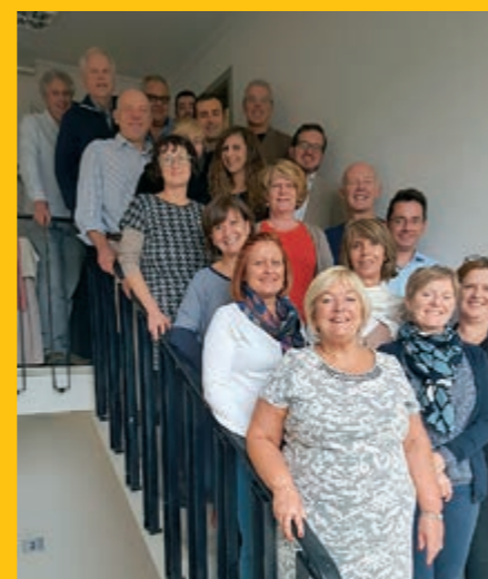
EUSEn kokouksen edustajat Manchesterissa/Brysselissä yhteispotretissa.

Kansainväliset verkostomme laajenivat entisestään vuoden 2016 aikana. Jatkossa tavoitteena on löytää verkostoista lisää synergiaa ja saada kotimaisia toimijoita mukaan yhteistyöhön. Uutena mahdollisuutena näemme yhteistyön mm. EU:n työllisyys- ja sosiaaliasioiden sekä Euroopan neuvoston sosiaalisen toimialan kanssa. Etenkin Euroopan Komission hyväksymään vammaisstrategiaan liittyvä ja sen kautta viriävä yhteistyö voi tuoda kansainväliseen toimintaamme uusia työtapoja. ✂