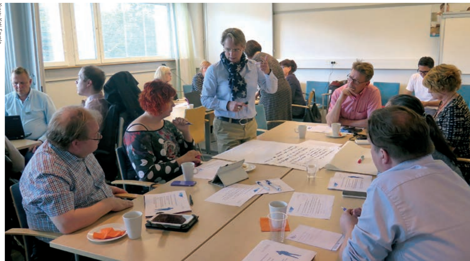
Vammaisten henkilöiden yrittäjyys ja sen tuki -selvitykseen kuului työpajoja, joissa oli mukana kohderyhmään kuuluvia ja asiantuntijoita. Työpajoissa pohdittiin mm. sitä, mihin asioihin vammaiset henkilöt tarvitsevat eniten tukea yritystoiminnassaan.

hyödynnettiin viestinnässä, ja M/S SOSTE -seminaariristeilyllä järjestettiin verkostotaapaaminen. Kaiken kaikkiaan tietoisuus yhteistyöryhmästä ja sen kautta vaikuttamisesta on saavuttanut alueellisia toimijoita entistä paremmin.