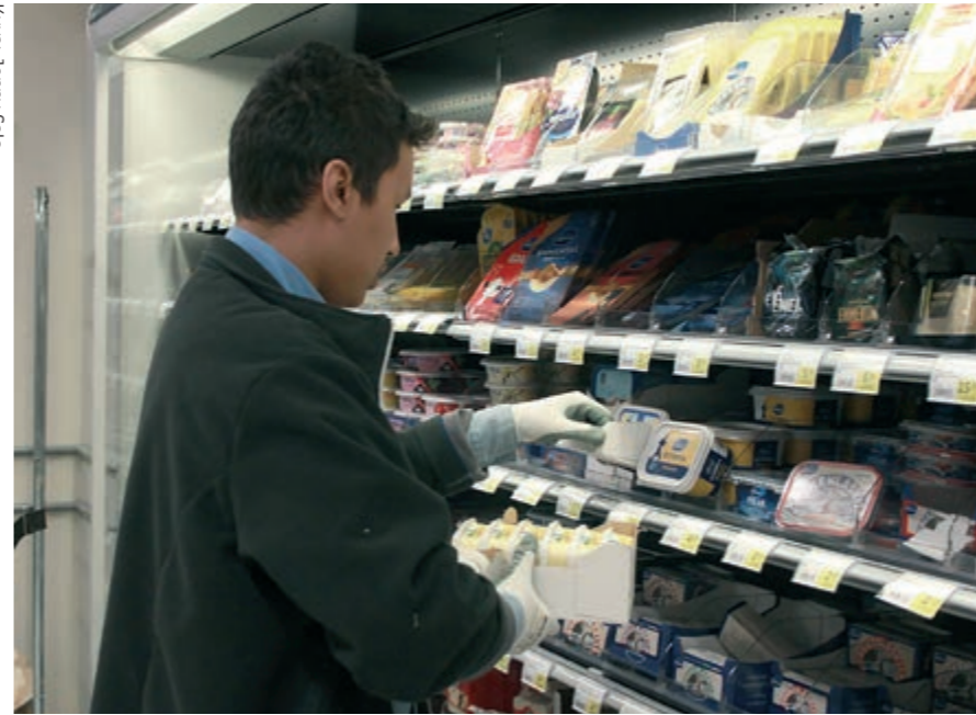
Työpaikka voi löytyä esimerkiksi työssäoppimis- tai harjoittelujakson kautta.