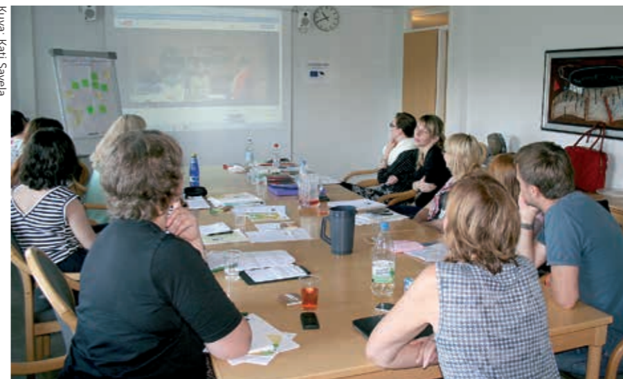
Virolaiset tuetun työllistymisen kouluttajat täydensivät osaamistaan Suomessa. Vates oli yksi koulutuksen toteuttajista.