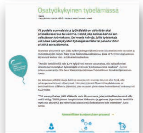
Tiedolla vaikuttaminen -hankkeen mediaosumia vuodelta 2015.