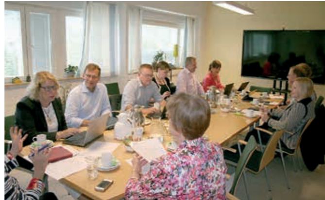
Hallituksen kokoukseen elokuussa osallistuivat sekä väistyvä (etualalla selin) että uusi toimitusjohtaja (ikkunanpuoleinen rivi kauimmaisena).

Valtuuskunnan kokous järjestettiin Vates-päivien yhteydessä, ja sen jäsenillä oli mahdollisuus osallistua Vates-päiviin. Valtuuskuntaan ei vuoden aikana tullut uusia taustayhteisöjä.