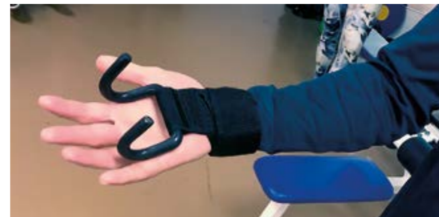
Kelan sopeutusvalmennuksessa keväällä 2022 Varis kuuli iron gripeistä, jotka tekevät otteen saamisen tavaroista helpommaksi.

Varis kaataa vaaratonta agarliuosta maljoille. Sormet ovat kovilla litran pulloakin puristaessa, mutta pienempään ei voi siirtyä, koska agar kuohuu autoklaavissa eli paineastiassa.