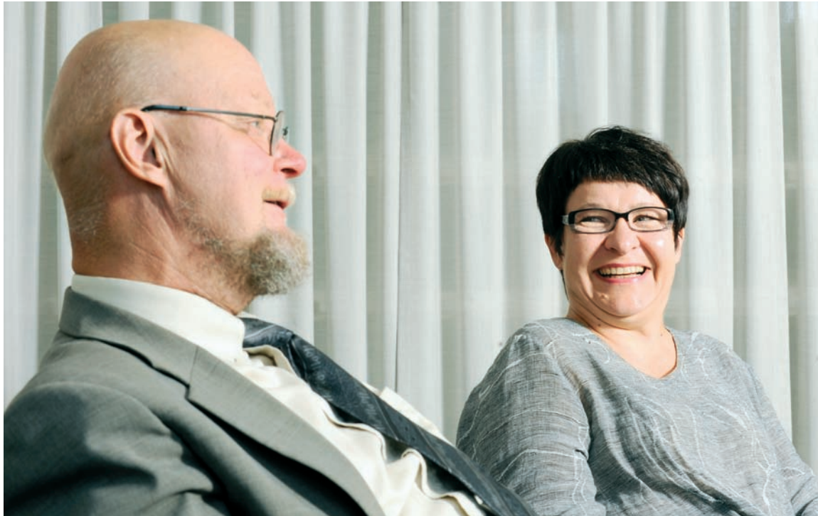
Vakavan keskustelun lomassa hersyi myös huumori.

työkyvyttömyyseläkeläisten ansaintatuloihin, niin virkamiesten vastustus sitä vastaan oli erittäin voimakasta. Se oli jopa niin voimakasta, että virkamiehet kirjoittivat mietinnön tätä koskevan lainkohdan vastoin komitean jäsenten näkemystä.