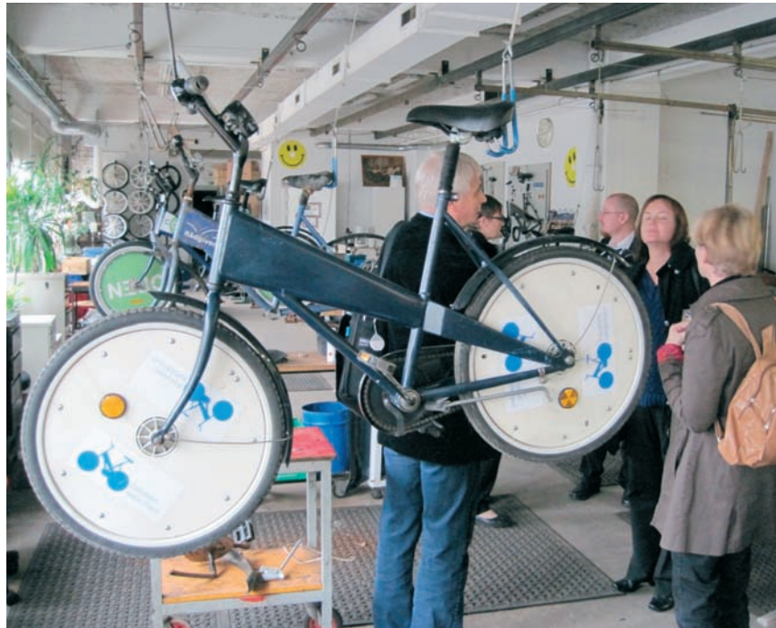
Kaikkien vaikeimmin työllistettävät henkilöt huoltavat Kööpenhaminan kaupunkipyöriä työllistämispalveluja tarjoavassa Incita-säätiössä, johon Askel-hanke tutustui Tanskan opintomatalla keväällä.

Suomessa on tutkittu mieluummin syrjäytyneiden ihmisten ominaisuuksia kuin niitä poliittisia ratkaisuja ja työ-