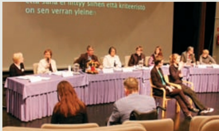
Esteettömyyden edistämistä Esok-hankkeessa pohtivat korkeakoulujen eri intressitahojen kanssa mm. vammaisjärjestöjen ja korkeakoulutettujen ammattiliittojen edustajat.

töjen tutkimussäätiö, Otus, julkaisi vuonna 2007 tutkimuksen vammaisten ja kuurojen nuorten koulutuspoluista. Esok-hankkeessa puolestaan julkaistaan oppaita, joissa on ohjeita opiskelijoiden monenlaisuuden huomioimiseksi opetuksessa ja ohjauksessa.